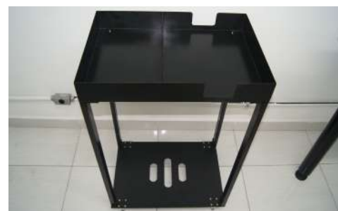
Mesa suporte para bandeja de cédulas.