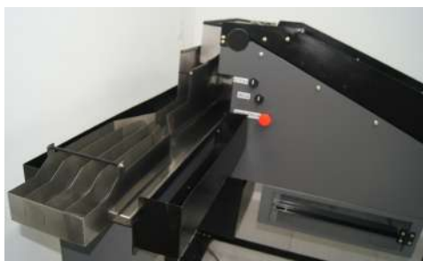
Rápida, robusta e confiável.